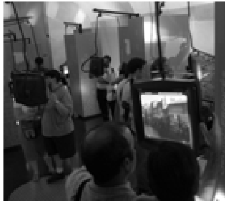
Figura 2. Ventanas virtuales

Caminos de Santiago : La instalación cuenta con varios de estos dispositivos, cada uno de los cuales permite la visita de distintos paisajes y poblaciones de cada una de las cinco rutas principales que componen este fenómeno de peregrinación dentro de la Península Ibérica, como aparecen en la figura 2.